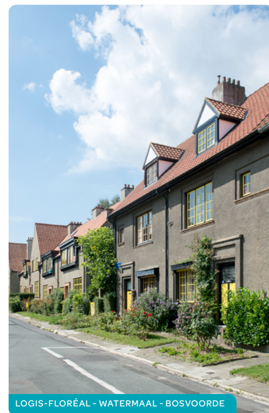
LOGIS-FLORÉAL - WATERMAAL - BOSVOORDE

Deze bedragen worden verhoogd met 2.618,96€ per kind ten laste en met 5.237,91€ per meerderjarige persoon met een handicap. Een kind ten laste met een handicap = 2 kinderen ten laste.