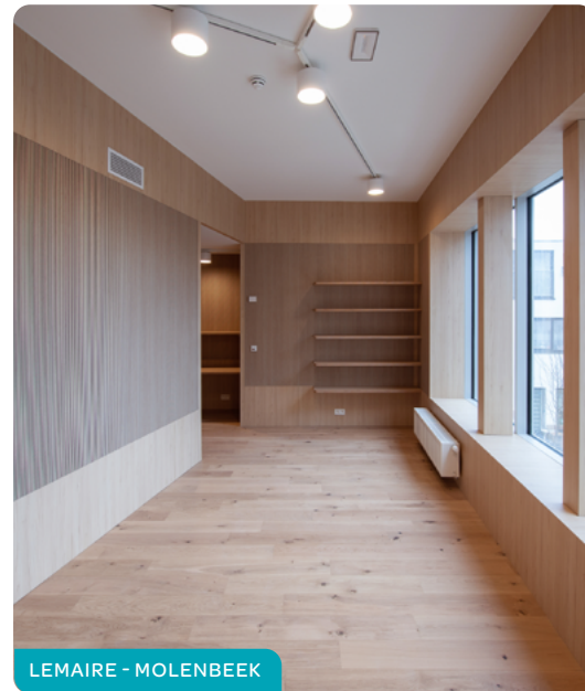
LEMAIRE - MOLENBEEK

Als er geen gevolg werd gegeven aan uw kandidatuur of als u vindt dat uw inschrijving onterecht werd geweigerd, kan u klacht indienen. Daarvoor moet u een aangetekende brief sturen naar de zetel van de betrokken maatschappij of een brief tegen ontvangstbewijs afgeven. Deze procedure wordt bepaald in art. 76 van de Brusselse Huisvestingscode.