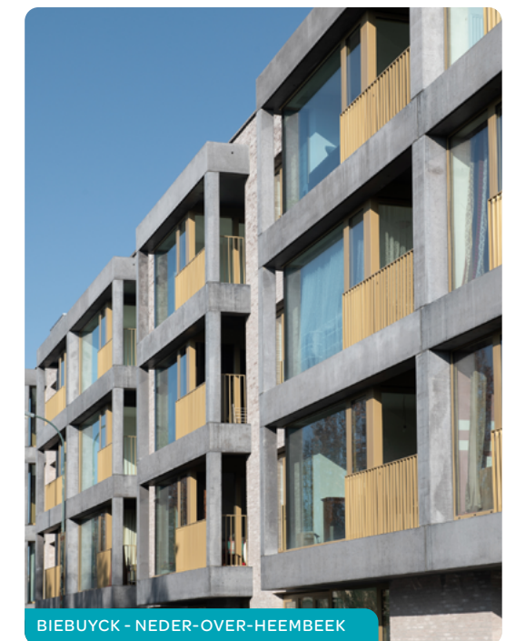
BIEBUYCK - NEDER-OVER-HEEMBEEK

Op ieder moment kan u OVM's en gemeenten toevoegen of schrappen uit uw aanvraag, behalve indien er voor u een toewijzingsprocedure voor een woning aan de gang is.