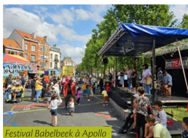
Festival Babelbeek à Apollo

Qu'il s'agisse des fêtes des voisins à Evenepoel, Marbotin, Helmet ou Colonel Bourg, du Festival des Arts de Rue Babelbeek ou encore d'initiatives originales comme « Apollo en Couleurs » ou « Habitons Scutenaire », les divers sites nous ont offert de belles animations.