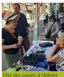
Fête des voisins à Helmet

Merci à tous les organisateurs, partenaires (PCS, associations, services communaux, ...) et participants d'avoir fait rayonner les quartiers dans la gaieté et la joie de vivre.