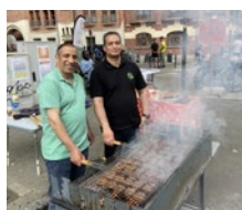
Fête des voisins à Marbotin