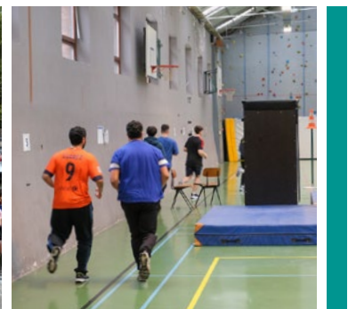
COPmittee: Fietsparcours, Canal It Up en functioneel parcours van de politie.