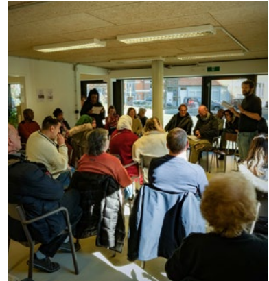
Réunion d'habitants à Apollo

Ces réunions, organisées dans vos quartiers, permettent de vous informer sur les projets du FSH, les événements, les changements ou nouveautés. C'est aussi l'occasion de vous sensibiliser à des thématiques précises telles que la gestion des déchets, de l'énergie, des nuisibles, ... Ces rencontres se veulent être avant tout des moments d'échange et de partage entre les collaborateurs du Foyer Schaerbeekois et vous, locataires, qui êtes invités à donner votre avis et proposer des améliorations.