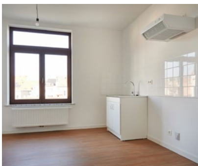
56-58 rue Van Droogenbroeck

La rénovation intérieure de 16 logements situés rue Van Droogenbroeck 56-58 s'est récemment achevée.