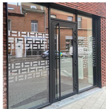
De vaccinatieantenne in Helmet