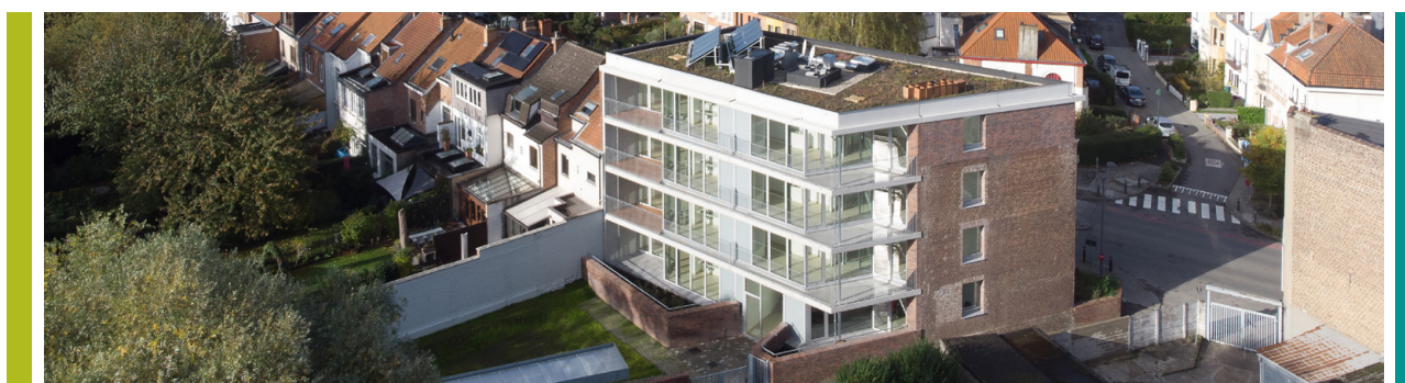
8 nieuwe woningen in de Charles Gilisquetlaan 147

(FSH) Schaarbeekse Haard / Trooststraat 70 / B-1030 Brussel / T- 02 240 80 40 lefoyerschaerbeekois@fsh.be / foyerschaerbeekois.be