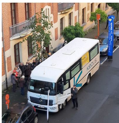
De Vacci-Bus in Marbotin

U kunt er zich elke zaterdag van 10u tot 17u onder perfect toezicht laten vaccineren, en dit tot eind maart 2022.