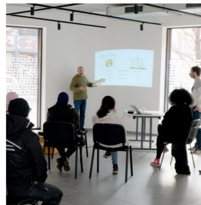
Sensibiliseringsvergadering in Helmet

Om onaangename verrassingen door de stijging van de energieprijzen te vermijden, heeft de FSH u eind november 2021 per brief op de hoogte gebracht van de verhoging van uw lastenprovisies. Het is dus belangrijk dat u profiteert van performante installaties en dat u deze op een correcte manier gebruikt om uw verbruik zoveel mogelijk te beperken.