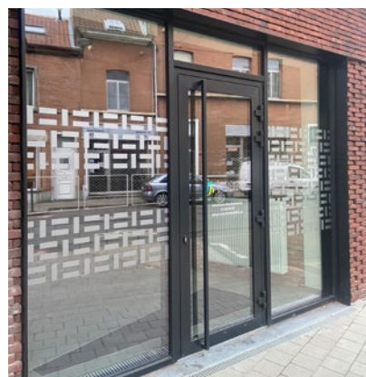
Antenne vaccination à Helmet