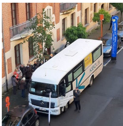
Le vacci-bus à Marbotin

Il est possible de vous y faire vacciner de manière parfaitement encadrée tous les samedis de 10 à 17h et ce jusque fin mars 2022.