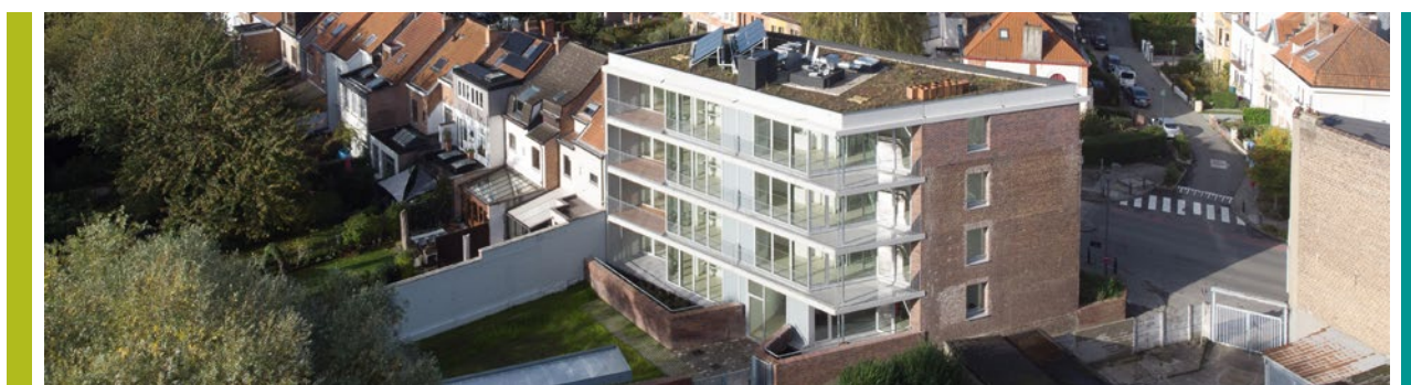
8 nouveaux logements au n°147 de l'avenue Charles Gilisquet

(FSH) Foyer Schaerbeekois / rue de la Consolation, 70 / B-1030 Bruxelles / T- 02 240 80 40 lefoyerschaerbeekois@fsh.be / foyerschaerbeekois.be