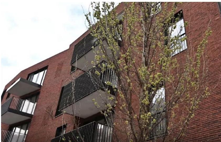
Wederopbouw Van Droogenbroeck