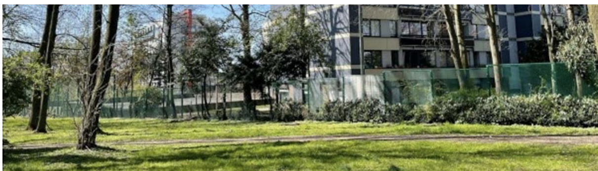
Zicht vanaf de parksite naar de achterzijde van het complex Evenepoel

(FSH) Schaarbeekse Haard / Trooststraat 70 / B-1030 Brussel / T- 02 240 80 40 lefoyerschaerbeekois@fsh.be / foyerschaerbeekois.be