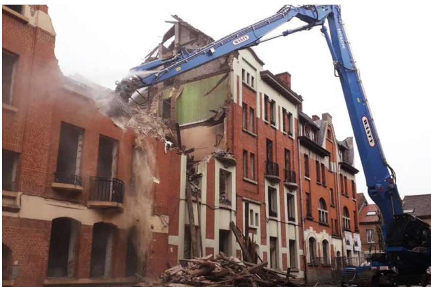
Afbraak Van Droogenbroeck

De huurders blijven centraal staan voor de FSH. 45 gezinnen hebben hun intrek genomen in nieuwe appartementen in Helmet en met de geplande werken zullen er nog veel meer vrijkomen, aangezien niet minder dan 38 gebouwen gerenoveerd worden in de wijk die in volle beweging is. De werken maken deel uit van een ambitieus renovatieplan van 840 woningen van de Schaarbeekse Haard, waaronder 237 alleen al in de Helmetwijk.