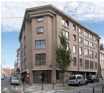
Het gebouw aan de Raafstraat 2 met het gemeenschapslokaal op het gelijkvloers

De FSH maakt deze visie nu concreet met de realisatie van het renovatieproject dat tot stand werd gebracht aan de hoek van de Helmetsesteenweg en de Raafstraat. Er kwam 1 gemeenschapslokaal op het gelijkvloers en 9 sociale appartementen voor ouderen op de 1e en 2e verdieping. De bovenste verdiepingen bestaan uit particuliere woningen. Door het samenwonen van sociale en particuliere huurders is dit ook een project van integratie en sociale mix.