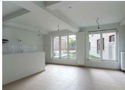
Woning met uitzicht op het groendak

Het gemeenschapslokaal op het gelijkvloers wordt ingenomen door de vzw Metiss'âges, die een participatief project met de ouderen van het gebouw, maar ook met de bewoners van de wijk zal opzetten. De vzw zal diensten uitbouwen, in het bijzonder voor ouderen.