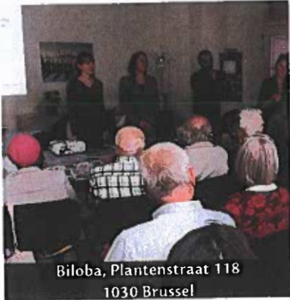
Biloba, Plantenstraat 118 1030 Brussel