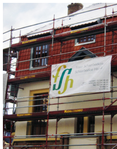
Tijdens de werken