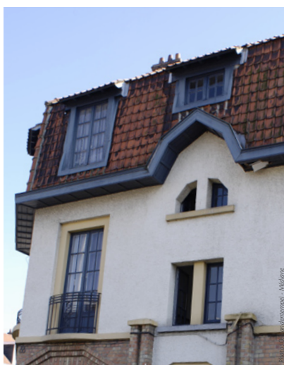
Voor de werken

De ramen, daken en gevels van deze 17 woningen zullen gerenoveerd zijn tegen januari 2013. De huurders zullen het verschil reeds op hun volgende gasfactuur merken. •