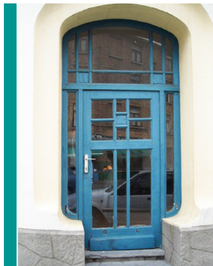
Identieke renovatie: voor

Een reeks andere projecten zijn in voorbereiding en zullen in de komende jaren uit de grond rijzen. We houden u zeker op de hoogte!