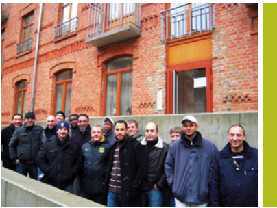
De ploeg van de Technische Regie