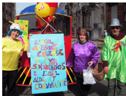
Les clowns et princesses d'Agissons Ensemble

Une participation saluée par nos édiles communaux, signe du dynamisme de nos partenaires: