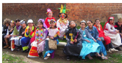
Les déguisés du Marbotin