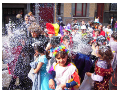
Une pluie de confettis...