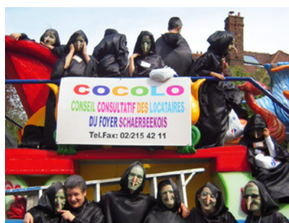
Le groupe des sorcières du Cocolo.