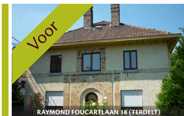
RAYMOND FOUARTLAAN 18 (TERDELT)

(FSH) Schaarbeekse Haard / Trooststraat 70 / B-1030 Brussel / T- 02 240 80 40 / F- 02 240 80 60 / lefoyerschaarbeekois@fsh.irisnet.be Permanentie / maandag-woensdag-vrijdag van 7.30 uur tot 11.30 uur / donderdag van 7.30 uur tot 11.30 uur en van 13.30 uur tot 15.30 uur