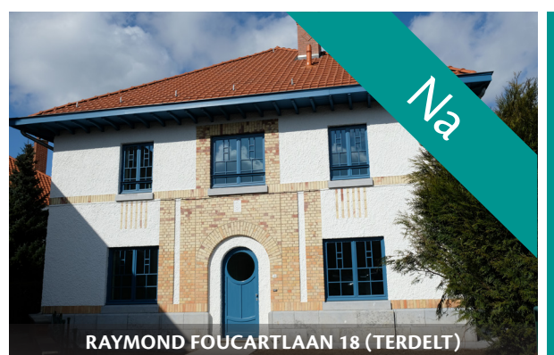
RAYMOND FOUARTLAAN 18 (TERDELT)