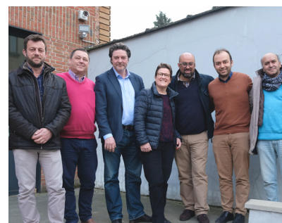
Het Bestuurscomité en, links, de algemeen directeur

We hebben ook erg intens gebruikgemaakt van sociale begeleiding. Naast het beheer van de algemene moeilijkheden waarmee