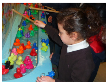
La pêche aux canards